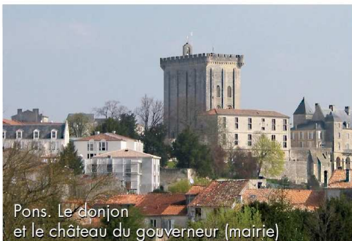
Pons. Le donjon et le château du gouverneur (mairie)

par Saujon, pour se rendre alors à Le Gua, hameau où se trouve la plaque commémorative du 400ème anniversaire de l'Acadie et l'on poursuit jusqu'à la magnifique abbaye de Sablonceaux (D131) dans laquelle se trouvent les armoiries de la famille. En effet, fief familial, on retrouve à quelques km de là, par la D131 et D243, commune de Meursac, au château Châtelard, sur la cheminée principale, ces mêmes armoiries dans cette demeure de l'arrière grand-père Loubat Dugua « Capitaine des châteaux de Royan », que Pierre Dugua de Mons a fait apposer à l'entrée même de l'Habitation de Port-Royal : « l'estoille et un croissant d'argent et champs de gueules et une bande d'or par milieu ».